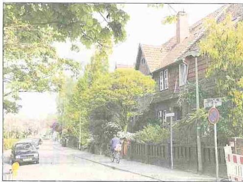
Wohnparadies mitten in der Stadt: Einfamilienhäuser in der Anton-Schumacher-Straße.

Die relativ kleinen Wohnungen in den nach dem Krieg errichteten Häusern im Bereich Prager- und Grazer Straße seien besonders bei älteren aber auch bei ganz jungen