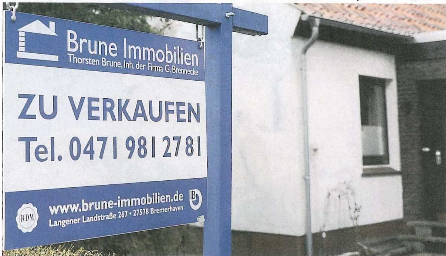
Zu verkaufen – in der Stadt gibt es zu viele einfache und ältere Häuser, die den Eigentümer wechseln sollen. Deshalb sinken die Preise weiter.